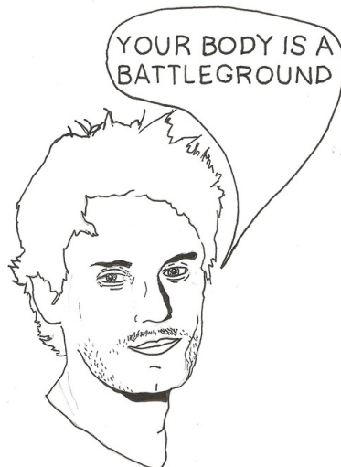
FEMINIST JOHN MAYER

Veckans av Séamus Gallagher. (första) serie