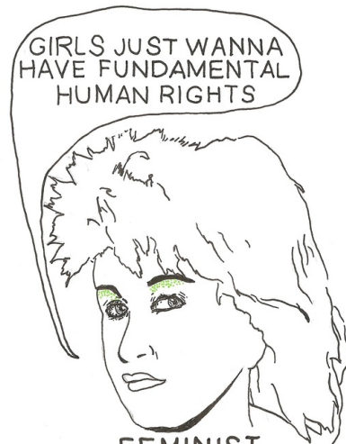
FEMINIST CYNDI LAUPER