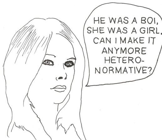
FEMINIST AVRIL LAVIGNE